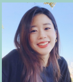
글 | 오주원 (뉴욕밀알, 자원봉사자)

첫 회 방송 전 다들 긴장하고 있던 저희 진행자들에게 목사님이 하신 말씀이 생각납니다. 어차피 우리 식구들끼리 보는 거니까 그렇게 떨지 않아도 된다고... '우리 식구'라는 말이 참 따뜻하게 다가옵니다. 우리는 세상에서 장애인과 일반이라는 두 단어로 불리지만 그런 우리가 밀알이라는 한 곳에 모여 함께 웃고, 찬양하고, 예배드리는 한 식구라 불릴 수 있음에 감사합니다. 앞으로도 저희 밀알 커넥트와 같은 장애인과 일반인이 같이 소통할 수 있고 장애인 친구들의 사는 모습을 스스럼 없이 보여줄 수 있는 미디어들이 많이 생겨나면 좋겠다는 것이 저희 뉴욕밀알의 바람입니다. 🍀