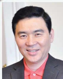
글 | 강원호 목사 (세밀연 부총재, 뉴저지밀알 단장)